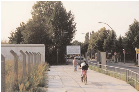
DIE BERLINER MAUER NACH DER ÖFFNUNG

Wenn einer in den anderen Teil der Stadt wollte, brauchte er dazu eine Genehmigung. Es war eine ganz unmenschliche Angelegenheit, weil doch Familienverbindungen und Freundschaften durch diese Mauer unterbrochen waren. Als Bürgermeister musste man sich immer darum bemühen, dass diese Mauer- teilung von Berlin für die Menschen einigermaßen erträglich wird oder bleibt. Es war sehr schwierig, aber für mich eine außerordentlich lehrreiche und sehr wichtige Zeit.