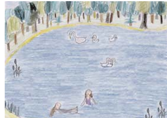
ICH GEHE MANCHMAL ZUM SCHLACHTENSEE...

Ja. Ich gehe manchmal zum Schlachtensee. Wart ihr da auch mal?