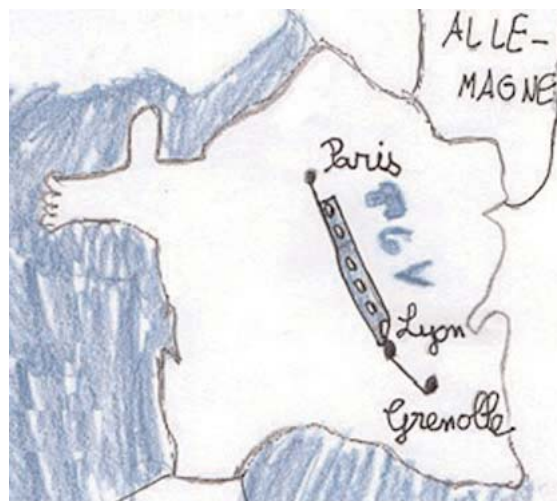
DER TGV-SCHNELLZUG PARIS-LYON

empfangt er mich sehr freundlich, und dann musste ich sofort auf Französisch eine Erklärung abgeben. Furchtbar, also schwierig war das. Ich finde es wunderbar, dass ihr so fabelhaft gut Deutsch und Französisch könnt.