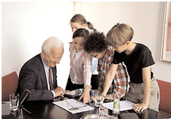
WIR ZEIGEN UNSERE ZEITUNG.

Der Grand méchant loup hat mit Richard von Weizsäcker gesprochen, der von 1984 bis 1994 Bundespräsident war. Da waren wir noch nicht geboren. Wir haben uns aber sehr gut verstanden und nicht nur erfahren, dass ein Bundespräsident nicht dem französischen Staatspräsidenten gleich ist, sondern auch, dass man nicht traurig sein muss, wenn man nicht mehr Präsident ist.