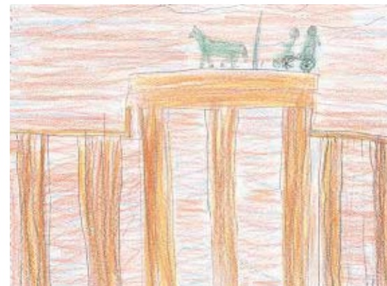
DAS BRANDENBURGER TOR IN BERLIN

ist der Chef der Regierung. Er kann mit seiner Regierung seine Regierungsmaßnahmen treffen, ohne den Präsidenten zu fragen, aber der Kanzler kann allein keine Gesetze erlassen. Der Bundespräsident muss erst einmal unterschreiben. Der Bundeskanzler hat in der Regierungspolitik eine deutlich stärkere Stellung als der Bundespräsident.