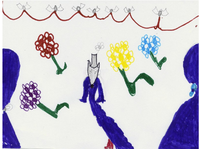
Jemand als Wölfin verkleidet