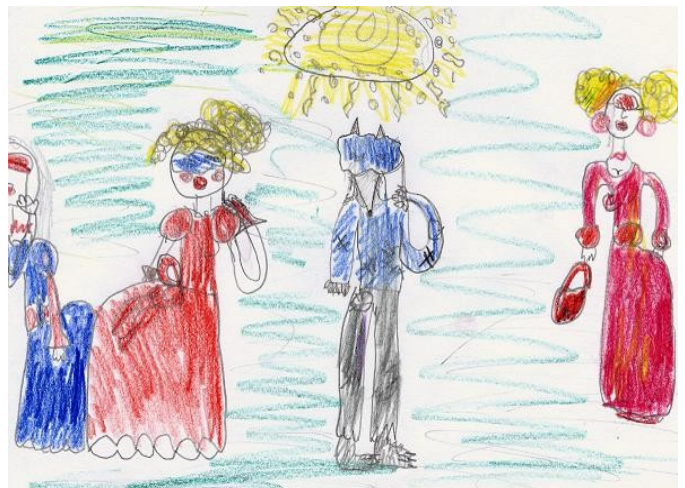
Ein Werwolf mit besonderer Maske