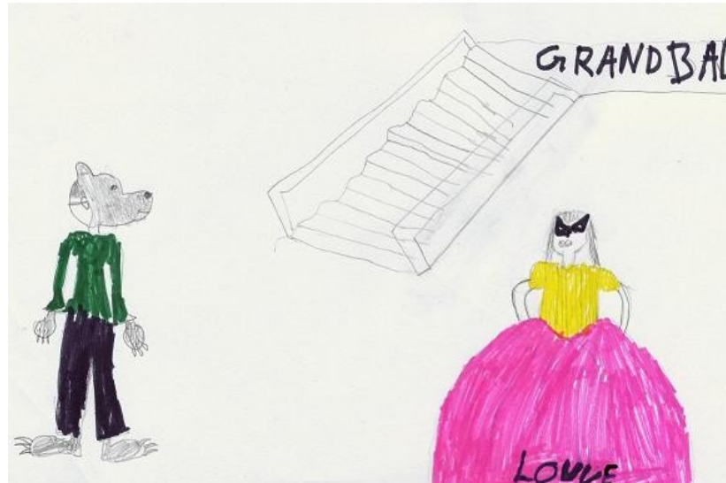
Sich als Wolf verkleiden mit einer besonderen Maske

Und was ist ein „loup“ beim Maskenball eigentlich?