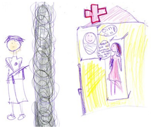
Les contrôles à la frontière (de Coralie)

A la frontière, je n'avais pas peur, même si les soldats étaient armés de fusils. Il fallait toujours faire une queue incroyable au début des vacances, c'était tous les Berlinoises de l'Ouest qui partaient en direction de l'Allemagne de l'Ouest. Donc on devait attendre parfois pendant deux heures, deux heures et demie pour pouvoir sortir de Berlin. C'était vraiment une situation un peu folle.