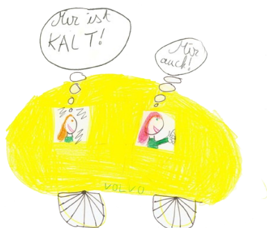
En route, il faisait froid (de Clara)

De rigoler?! Bon, c'est vrai, parfois il y avait des situations rigolotes. Je me souviens d'une fois où j'étais allée à Berlin-Est avec ma classe. Il fallait montrer sa carte d'identité à la frontière. Une vitre nous séparait des gardes-frontière qui avaient l'air toujours très méchant. On devait prendre aussi un air sérieux alors qu'on avait plutôt envie de rire.