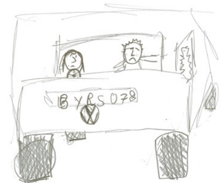
Mon père était vraiment très en colère... (de Jean-Victor)

fallu descendre et ils ont fouillé la voiture de fond en comble. Mon père a dû se faire faire des photos pour des nouveaux papiers d'identité. Et il était tellement en colère qu'il a claqué la portière si fort que la vitre s'est cassée. C'était en automne, il faisait déjà frais et on avait encore toute la route à faire. Dans la voiture, il faisait froid et on sentait des courants d'air. Mais ni mère, ni moi, on a osé dire quoi que ce soit pour ne pas énerver encore plus mon père. Tout le monde nous regardait d'un drôle d'air. Les soldats aussi parce qu'ils pensaient qu'on avait fait quelque chose de pas bien. Et évidemment, on se faisait remarquer avec la vitre cassée. J'avais honte et je me disais : Oh ! J'espère qu'ils ne vont rien nous faire de mal.