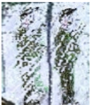
Es war etwas bedrückend

Eigentlich ständig. Wir sind mit der S-Bahn durch das Grenzgebiet Bornholmer Straße gefahren, es war neutrales Gebiet. Auf der einen Seite war die DDR und auf der anderen Seite West-Berlin. Die Züge fuhren durch, ohne zu halten. Mit dieser Grenze hatte man immer den Eindruck, alles sei tot.